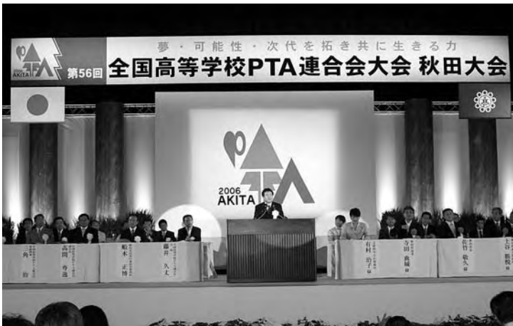
第56回全国高P連大会(秋田大会)開会式

開会式に続き、優良PTAの表彰。また、秋田県高校生等によるアトラクション・記念講演・分科会等が行われ盛会であった。