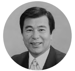
静岡県公立高等学校 P T A 連絡協議会

ホームページ : http://www.hs-pta-shizuoka.net/