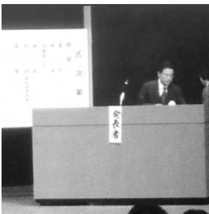
富士宮西高校PTAの発表

生徒のドリームプラン実現の一環として、PTA(家庭)・学校・社会(企業・福祉施設等)の共同で、夏休みにインターンシップを、一年生を対象として実施した。学校とPTAのコミュニケーションの良いことや、PTA理事の任期が三年で、理事同士の意思疎通も良く、学校だけでなくPTAも参画することで一層の成果を挙げた。