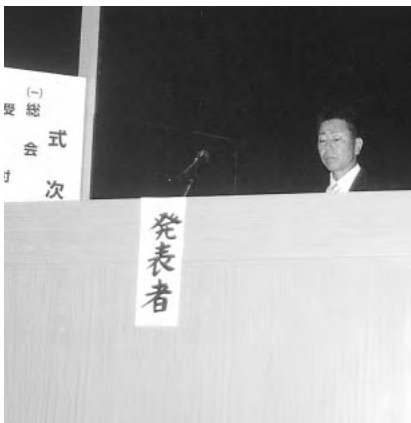
浜松東高校 P T A の発表